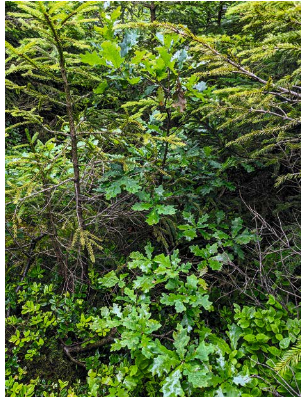
Eine einsame Eiche in einer Fichtenverjüngung. Ohne Förderung hat sie kaum Chancen. Mit Unterstützung schafft sie es vielleicht und wird zu einem wertvollen Samenbaum.

Doch wie gelingt dies? Neu aufwachsende Naturverjüngung soll immer bestmöglich auch an die zukünftigen Standortverhältnisse angepasst werden (u. a. Lichtdosierung). Wo das Samenangebot fehlt, sind Pflanzungen oder Saat zu prüfen. Hinzu kommen punktuell unterstützende Massnahmen wie Bodenschürfungen oder Verbisschutz. Insbesondere das Aufbringen von bisher nur beschränkt standorttauglichen Baumarten ist jedoch sehr anspruchsvoll und die Erfolgsquoten sind häufig gering, insbesondere wenn zusätzlich zu suboptimalen Wuchsbedingungen der Wildeinfluss übermässig stark ist.