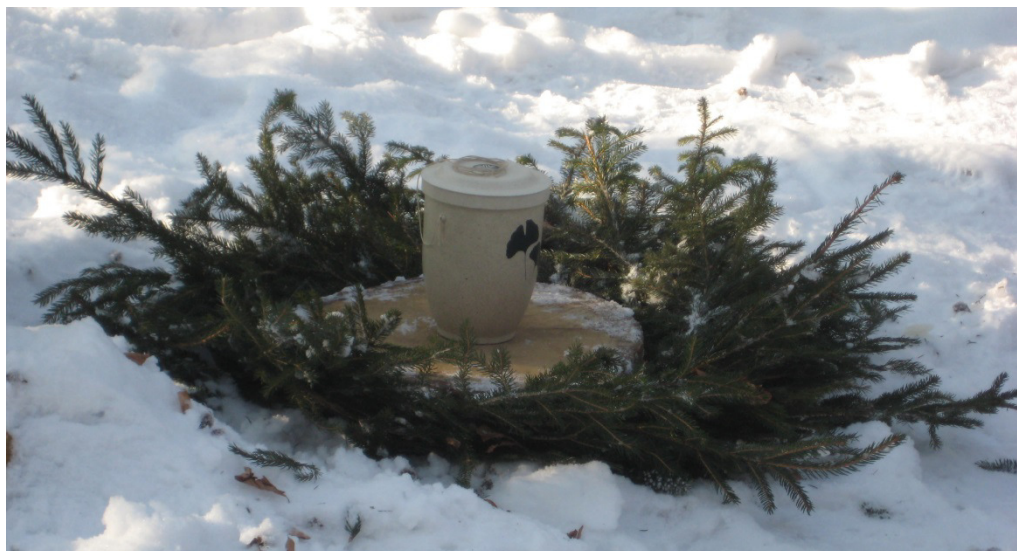
Abbildung 1: Schauurne im FriedWald Münsingen (BAUER 2012)

In Wäldern finden die Befragten Ruhe, Freiheit, eine wohltuende Atmosphäre, physische wie psychische Erholung und Entspannung. Auch sind die Interviewpartner mit hoher Naturverbundenheit vertraut mit der Vorstellung eines natürlichen Kreislaufs aus Werden und Vergehen (vgl. Abbildung 1). Dabei spielen Bäume in ihrer Zuschreibung als unverrückbar, standhaft, schützend, dauerhaft und lebendig eine bedeutsame Rolle. Vor allem in der Umgebung von vorrangig alten Bäumen empfinden die Befragten ein hohes Maß an Geborgenheit und Trost.