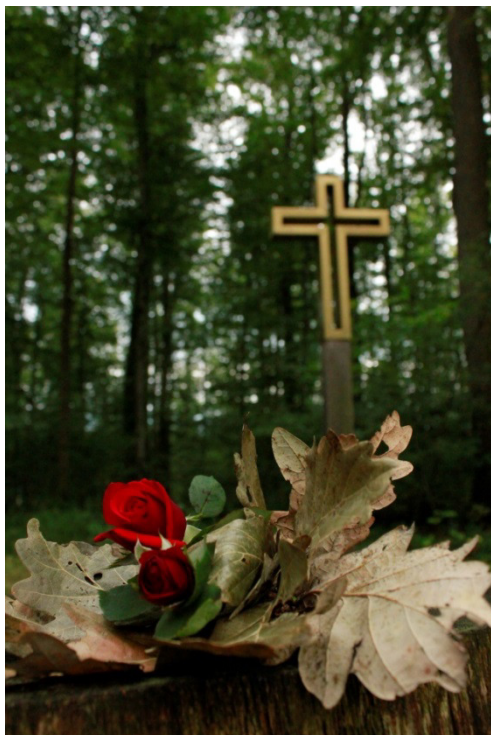
Abbildung 4: Christliche Symbolik im FriedWald Wangen (BAUER 2015)

Die Positionen der beiden großen Kirchen waren zunächst auch ablehnend bis skeptisch. In den vergangenen Jahren hat jedoch ein Prozess der Annäherung eingesetzt und es wird aktiv nach Wegen gesucht, die Bestattung im Wald in bestehende Rituale zu integrieren oder Konzepte auch zu erweitern (vgl. Abbildung 4).