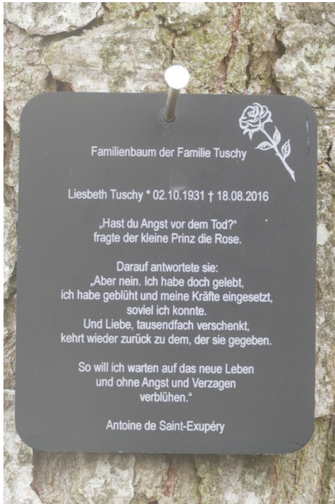
Abbildung 2: Familienbaum im FriedWald Schönbuch (SCHRAML 2017)

nicht. Und hier ist es Natur und wird wieder Natur“ (KO, 14). Mit der Wahl einer Baumgrabstätte wird der Tod außerdem nicht mehr tabuisiert und ausgegrenzt, sondern die eigene Sterblichkeit thematisiert. Zugleich können viele der durch den gesellschaftlichen Wandel entstandenen Bedürfnisse durch eine Baumbestattung befriedigt werden. Bestattungswälder bieten ein hohes Maß an spiritueller Offenheit und Raum für eigene Rituale des Abschiednehmens und der Trauerarbeit (vgl. Abbildung 2).