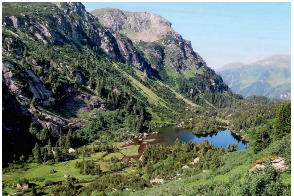
Abb 1 Oberes Murgtal (SG; im Bild) und angrenzendes Mürttschental (GL) umfassen zusammen die grösste Reliktpopulation der Arve ( Pinus cembra ) auf der Alpennordseite mit über 20 000 Individuen.

Rechtsgrundlage auf nationaler Ebene bildet die Waldgesetzgebung betreffend forstliches Vermehrungsgut, Förderung der biologischen Vielfalt des Waldes und Förderung von Forschung und Entwicklung. Die Strategie Biodiversität Schweiz bekräftigt mit dem strategischen Ziel 7.4 die generelle Bedeutung der Erhaltung von genetischer Diversität und von Genressourcen (BAFU 2012). Die Vollzugshilfe zur Erhaltung und Förderung der biologischen Vielfalt im Schweizer Wald erläutert die Ausscheidung von Generhaltungsgebieten (Imesch et al 2015). Ein nationales Konzept «Forstliche Genressourcen und