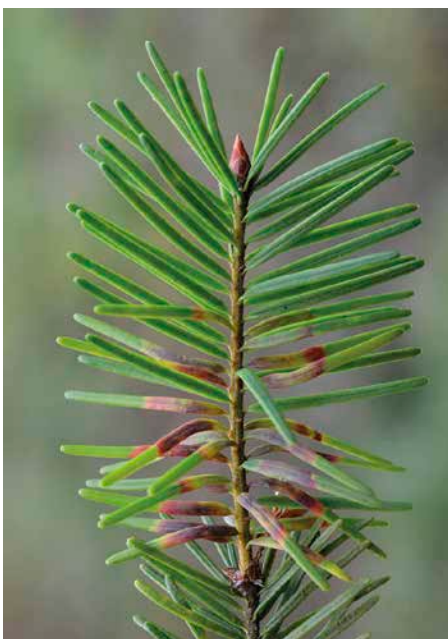
2 Typisches Befallsbild im Spätsommer am diesjährigen Nadeljahrgang.