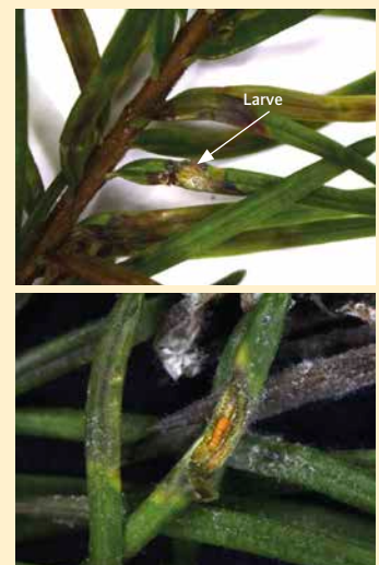
Oben: Befallene Nadel mit Verdickung (Galle); unten: Minierende Larve

Über das Flugvermögen gibt es keine gesicherten Daten. Die hauptsächliche Verbreitung erfolgt über Pflanzen, Schmuckreisig, Weihnachtsbäume und Erde von befallenen Pflanzen. Der zukünftige Einfluss der Douglasien-Gallmücken auf die Douglasie ist schwer vorherzusagen, aber es ist nicht auszuschließen, dass sie ein Problem für die Douglasie werden könnte.