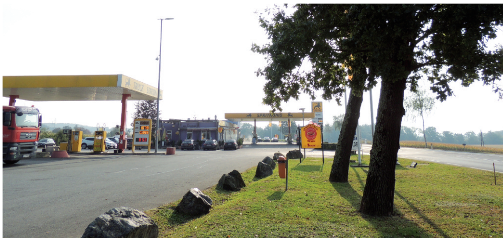
Abbildung 3: Mit Corythucha arcuata befallene Eichen an einer von LKW frequentierten Tankstelle an der stark befahrenen Gleisdorfer Bundesstraße B 65 im September 2020. Im Ausbreitungsgebiet war der Befall häufig mit Verkehrsinfrastruktur assoziiert.

Das Muster im etablierten Befallsgebiet und entlang dessen Randes deutet darauf hin, dass an mehreren Punkten entlang der Ausbreitungsrouten durch anthropogenen Ferntransport Satellitenpopulationen entstehen. Wenn diese sich etabliert und eine gewisse Populationsgröße erreicht haben, beginnt die lokale Ausbreitung. Diese erfolgt wahrscheinlich aktiv und geschieht, wie etwa die Wiederholung des Transekts bei Mureck 2019 und 2021 oder die Funde an einzeln stehenden Eichen in Mischbeständen 2021 zeigten, bemerkenswert rasch und erfolgreich. Wir folgen der Vermutung anderer Autoren, dass durch den Wind unterstützter Flug adulter Netzwanzen ausschlaggebend für die rasche Ausbreitung auf lokaler Ebene ist (z.B. Zubrik et al. 2019, Mutun et al. 2009). Zusätzlich konnte bei den eigenen Erhebungen beobachtet werden, dass die Eichennetzwanze ein guter Flieger ist und bei Windstille exakt gerichtete Flüge