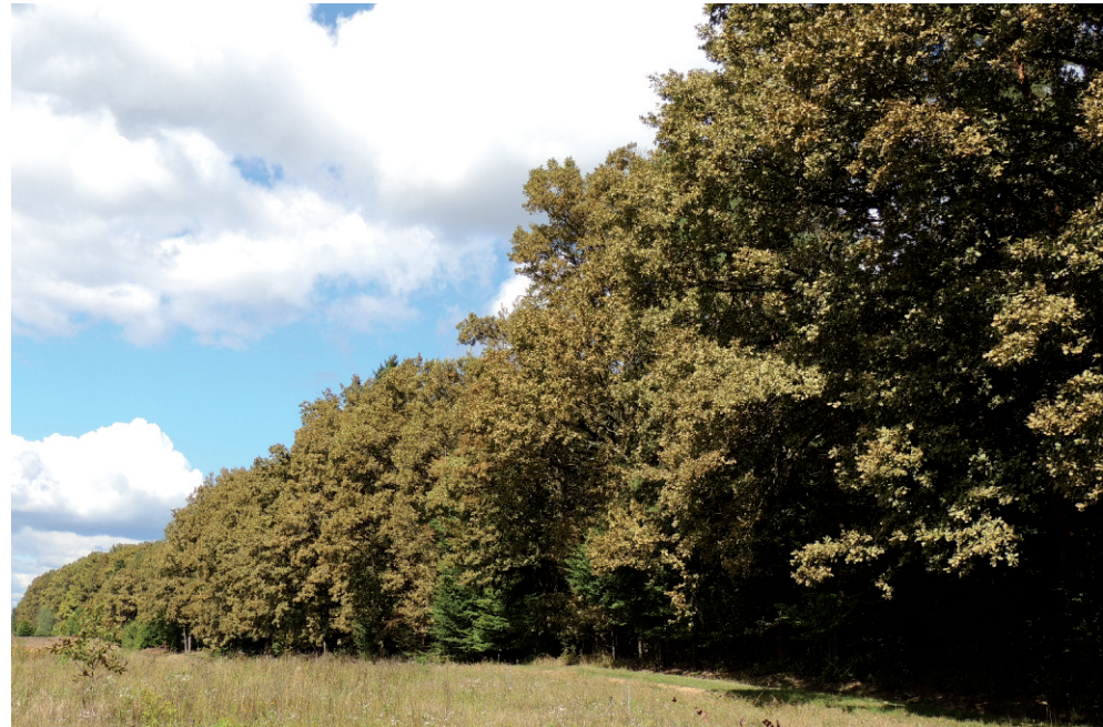
Figure 4: Heavily infested oak near the town of Fürstenfeld (a core area of the early infestations) in September 2022.

über kürzere Distanzen von sich aus ausgeht. Eine Ausbreitung von einer Krone zur nächsten ist aktiv möglich. Gewiss kann auch menschlicher Transport bei der lokalen Ausbreitung unterstützend wirken.