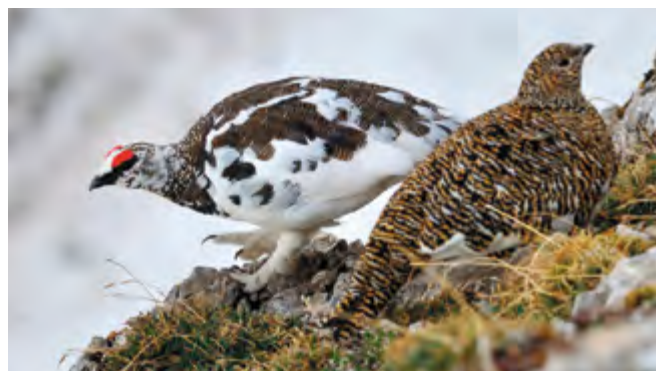
Grafik: Änderung der durchschnittlichen Höhenverbreitung der 71 häufigsten Brutvogelarten zwischen 1993–1996 und 2013–2016. Die rote Säule zeigt 16 Arten ohne Veränderung ( \pm 10 m), darüber zeigen 40 Arten einen Höhenanstieg, darunter 15 Arten eine tiefere Höhenverbreitung. Foto: Das Alpenschneehuhn ist besonders weit nach oben gewandert. Das Höhersteigen ist verbunden mit einer Reduktion des Verbreitungsgebietes. Quelle: Knaus et al 2018. Foto Corentin Morvan

Der Klimawandel verursacht bei den einheimischen Brutvögeln bereits substantielle Veränderungen. Ein Vergleich der Höhenverbreitung der 71 häufigsten Schweizer Vogelarten zwischen 1995 und 2015 zeigt, dass rund zwei Drittel der Arten ihr Verbreitungsgebiet innerhalb von 20 Jahren deutlich nach oben ausgedehnt haben (siehe Grafik). Der Schwerpunkt des durchschnittlichen Höhenvorkommens stieg um 24 Meter an. Besonders alpine Arten zeigen starke Veränderungen: Jene 10 Arten, die in der ersten Untersuchungsperiode die höchste mittlere Verbreitung aufwiesen,