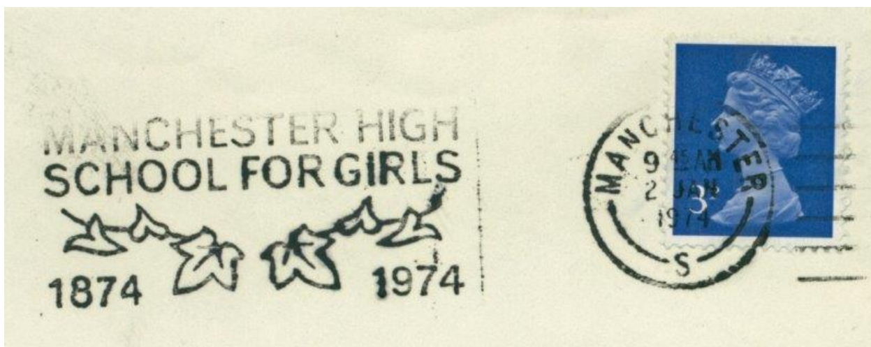
Efeublätter für verschiedene Zwecke auf Werbeflaggen.