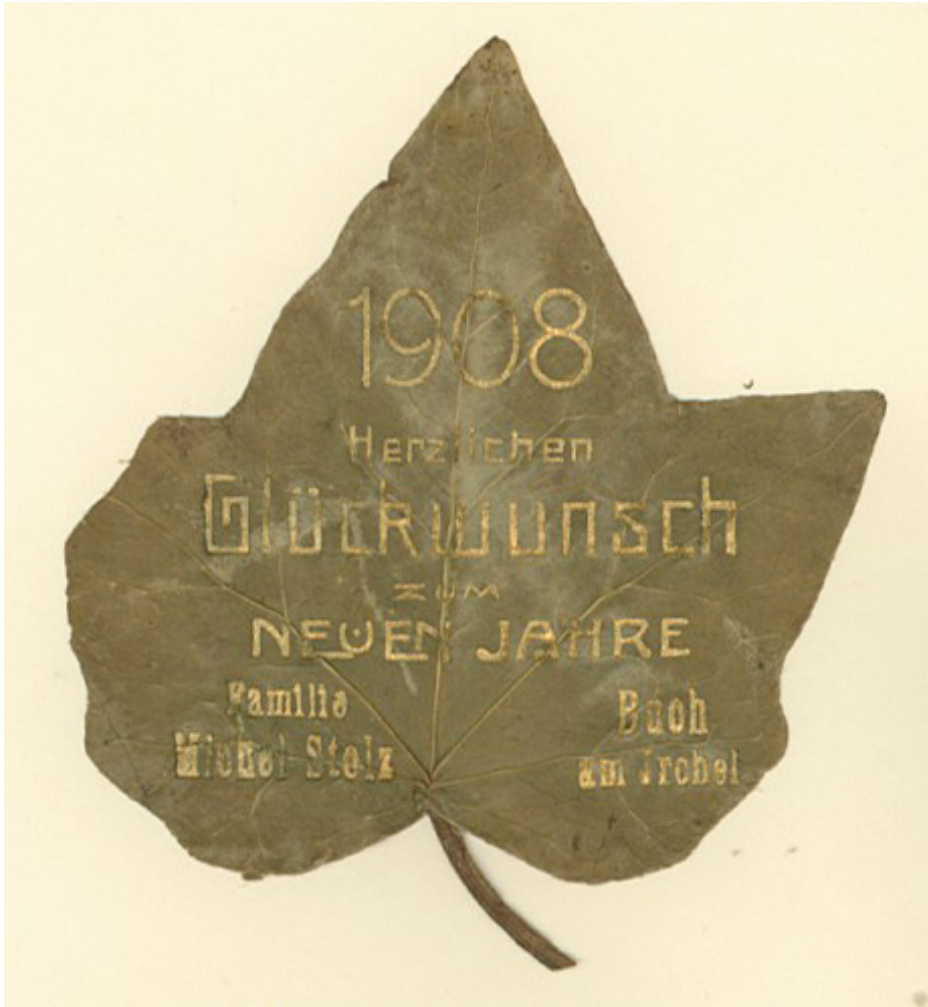
In Gold gedruckte Neujahrgrüsse (1908) auf einem Efeublatt; als Sinnbild für Glück.