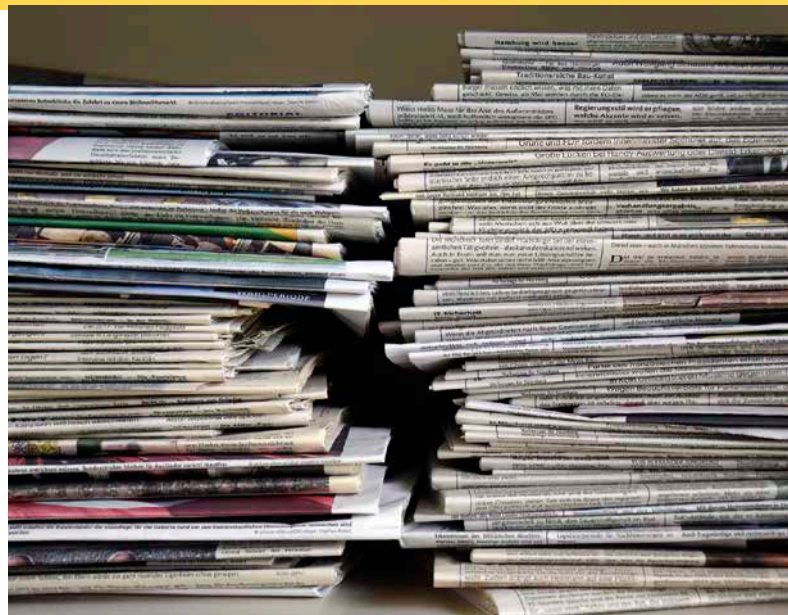
1 Im Gegensatz zu jüngeren Menschen bevorzugen ältere Menschen noch die klassischen Massenmedien wie Zeitung und Fernsehen als Informationsquelle.

Der Dialog mit der Gesellschaft ist für forstliche Akteure ein wichtiger Teil ihrer täglichen Arbeit. Die Bayerischen Staatsforsten, die Bayerische Forstverwaltung, aber auch Waldbesitzervereinigungen treten regelmäßig über ihre Öffentlichkeitsarbeit in Kontakt mit der Bevölkerung. Dabei informieren sie Bürgerinnen und Bürger über den Wald und ihre Aufgaben. Doch wie gut fühlen sich die Menschen in Bayern über den Wald aufgeklärt und welche Medien nutzen sie, um mehr über dieses Thema zu erfahren?