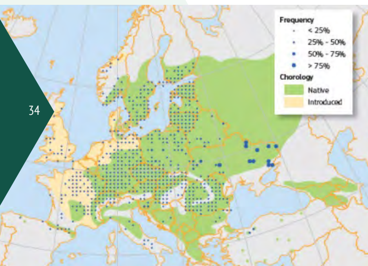
Abb. 1 Natürliche Verbreitung [4].

von Winterlinde und Bergahorn begleitet. Der Spitzahorn ist im Eschen/Ahorn-Steinschutt-Hangwald, in Linden/Hainbuchenwäldern und in Lindenmischwäldern vertreten [1].