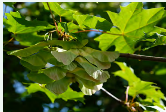
Blätter und Frucht des Spitzahorn