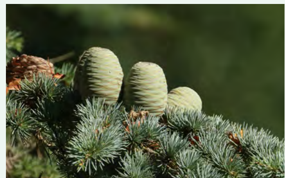
Nadeln und Frucht der Libanonzeder

Das Saatgut kann aus Frankreich von türkischen Provenienzen aus dem östlichen Verbreitungsgebiet (Anti-Taurus) bezogen werden [4]. Die Aussaat kann im Herbst oder Frühjahr in einer Tiefe von 1 bis 1,5 cm auf einem Substrat aus Sand, Gartenerde und Humus (1:1:1) erfolgen [2]. Zweijährige Sämlinge können erfolgreich ins Feld gepflanzt werden [1]. Die besten Monate für die Pflanzung sind November und April in einem Verband von 1,5 x 3 m. In den ersten 3 Jahren sollte krautige Konkurrenzvegetation entnommen werden [7]. Als Direktaussaat im Freiland wurden in